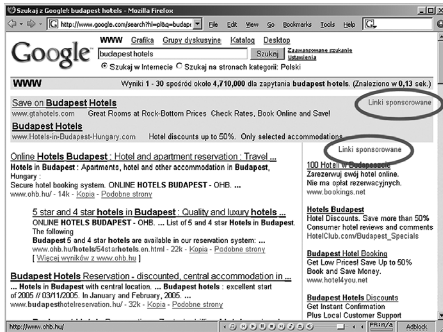
Rys. 3. Linki sponsorowane (górną i prawą stronę) w wyszukiwarce Google

Behavioral advertising – kierowanie behawioralne opiera się na przekazywaniu reklamy grupie użytkowników, która wydzielona jest na podstawie zachowania. Pojedynczy użytkownik rozpoznawany jest najczęściej poprzez pliki cookie , niekiedy w połączeniu z numerem IP komputera, z którego się łączy [1]. Przykładowym zachowaniem może być powtarzająca się aktywność polegająca na przeglądaniu treści powiązanych z podróżami po Europie. Takiej grupie osób będzie wyświetlana reklama z ofertą tanich przelotów po Europie. Reklama o tanich przelotach będzie prezentowana na wielu podstronach oglądanych przez wydzieloną grupę użytkowników. Emisja może mieć postać ROS, czyli bez uwzględnienia treści poszczególnych stron, liczy się fakt zainteresowania grupy daną tematyką. Zachowanie użytkownika jest więc kluczem decydującym o rodzaju kierowanej do niego reklamy.